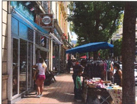
Ce week-end, les commerces de Menton seront plus que jamais mis en valeur.

Dans la lignée des aides proposées aux entreprises pour surmonter la période post Covid, la Ville de Menton propose tous les samedis l'opération « Happy shopping » en partenariat avec l'association de commerçants « Menton sourire ». À cette occasion, les professionnels qui le souhaitent sont autorisés à mettre un étalage devant leur boutique pour plus de visibilité, et bénéficient d'une musique d'ambiance devantant aux rues d'être davantage animées. Ce week-end, l'opération sera couplée à une seconde - « Le commerce fait son show » - étalée sur deux jours. Pour l'occasion le bord de mer sera réservé aux piétons. Au programme : une quarantaine de stands entre le