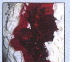
De gauche à droite : les œuvres de Bianca Tosti et Dieter Filler.