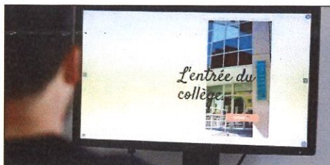
Cette visite virtuelle remplace les traditionnelles portes ouvertes de fin d'année.

« Nous avons voulu permettre aux nouveaux 6 es de se familiariser avec leur collège avant la rentrée. N'ayant pu le découvrir lors des portes ouvertes, organisées comme à l'accoutumée, confinement oblige, nous